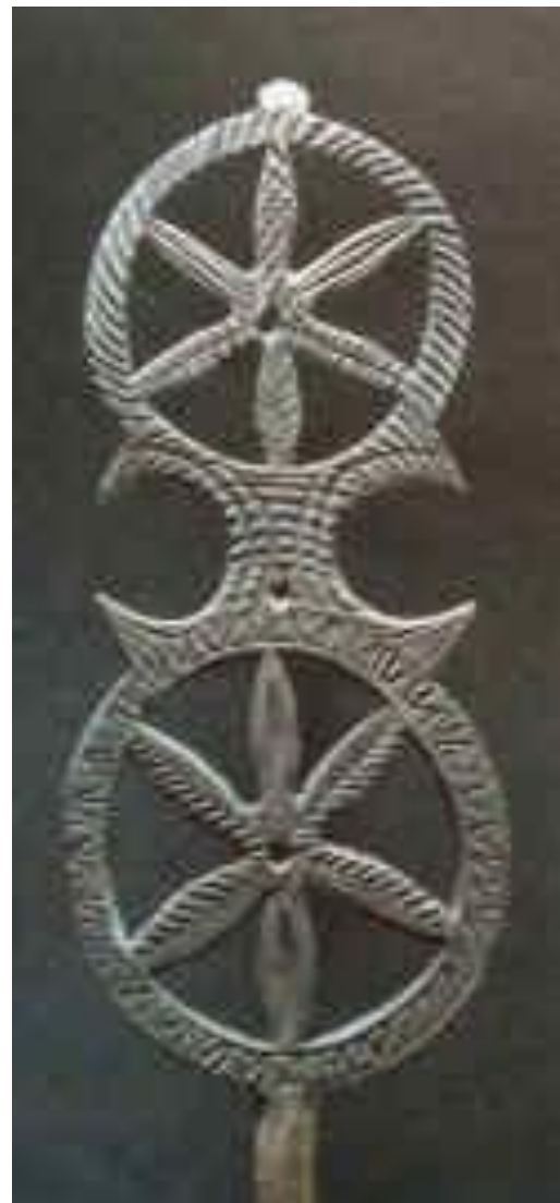
Prieverpstė. Akmenės r. 20 a. pr.

Puošyboje dominuoja saulės motyvai, segmentinės žvaigždės. Šie motyvai dažniausiai jungiami po du, ypač tose prieverpstėse, kurios turi dviejų sujungtų apskritimų formą. Kiti raštų motyvai - geometriniai.