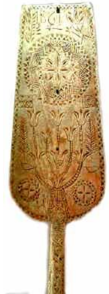
Verpstė. Rytų Lietuva. 1861 m.

Tarp pagrindinių komponuojami smulkūs geometriniai, stilizuotos augalijos, rečiau gyvūnijos motyvai, įrėžiami verpsčių padirbimo metalai. Motyvus harmoningai sujungia, įrėmina kriputės, dantukai, kurie dažniausiai puošia ir verpstės kotą.