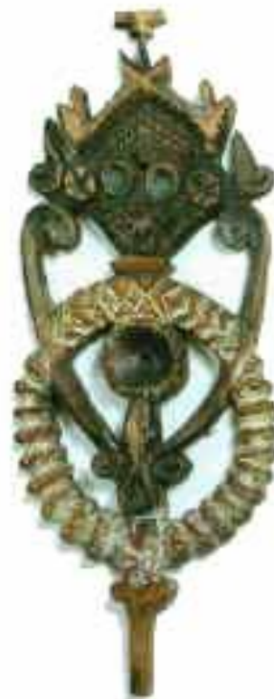
Prieverpstė. LNM. Klaipėdos r. Žadeikių k. 19 a. pab.