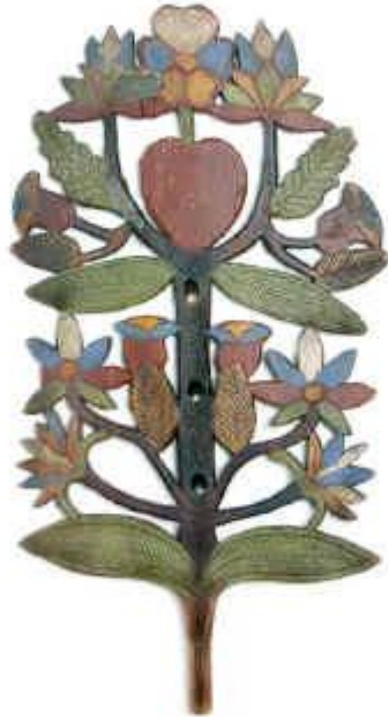
Prieverpstė. LNM. Akmenės r. 20 a. pr.

Prieverpstės išsaugojo ir verpsčių raštų simboliką. Daugumą jų vainikuoja apskritimėlis su segmentine žvaigždute. Taip pat vaizduojamas gyvybės medis. Augalai kartais panašūs į kraičių skrynių raštus, arba realius augalus ir nudažomi tamsiai raudonais, žaliais, geltonais bei juodais dažais.