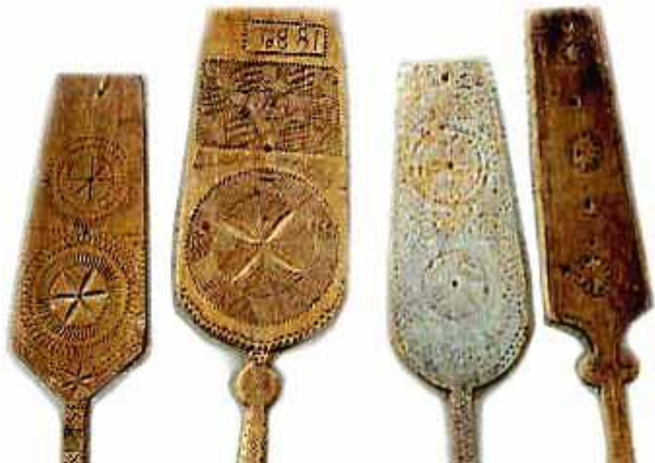
Verpstės. Nalšios muziejus. Etnografijos skyrius

Šie senoviškieji dangaus šviesulių simboliai verpstėse komponuojami po kelis. Jie derinami su rombų grupėmis, ženklinančiomis suartą dirvą. Puošyboje įkomponuoti giedantys, abipus tų šviesulių stovintys ar tarp jų segmentų bėgantys paukšteliai.