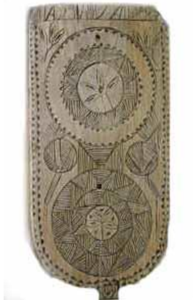
Verpstė. Našios muziejus. Etnografijos skyrius

Puošyboje vyrauja geometriniai raštai: apskritimai, užpildyti dvikryptėmis, įkypomis įraižomis, kurių viduryje – labai įvairios segmentinės žvaigždės.