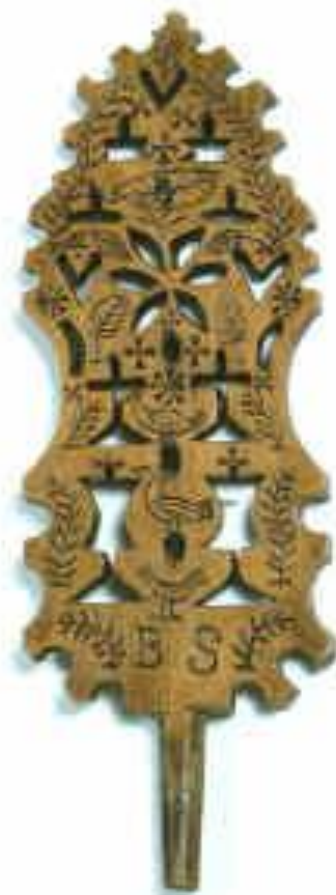
Prieverpstė. LNM. Plungės r. Medingėnų k. 20 a. pr.