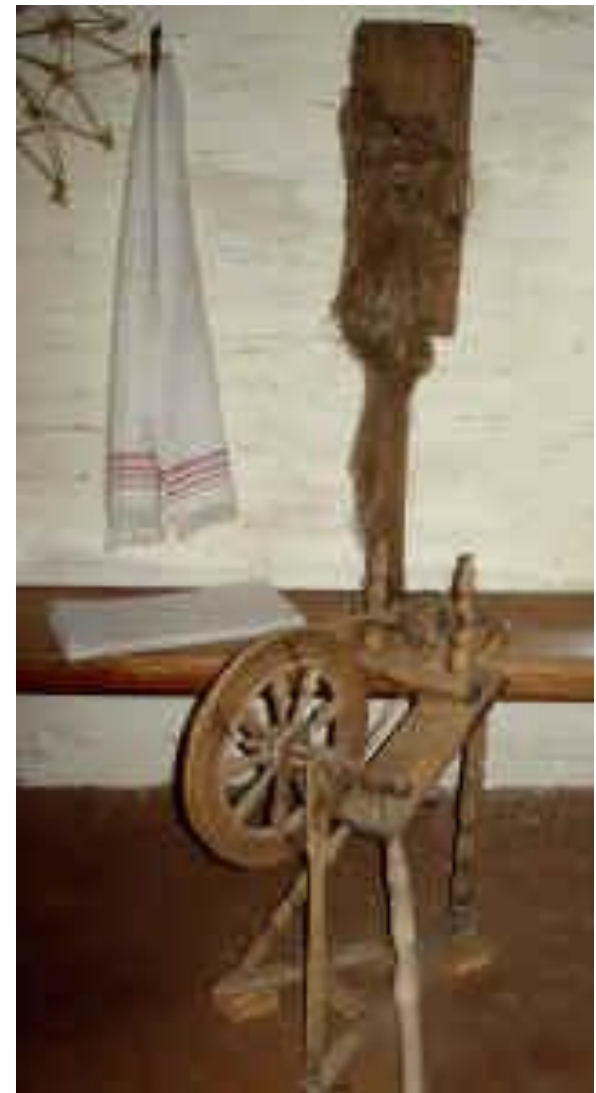
Verpstė ir ratelis. Drūkų pirčia. LBM. Rumšiškės

Rytų Lietuvoje verpste buvo verpiama iki 20 a. pradžios. Verpiant rateliu, išliko tik prieverpstė.