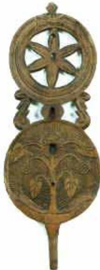
Prieverpstė. LNM. Klaipėdos r. Pažvelskio k. 20 a. pr.

Buityje buvo naudojami mediniai verpimo ir audimo reikmenys: verpstės, prieverpstės, kuodelių smeigtukai, verpimo rateliai, audimo staklės, šaudyklės.