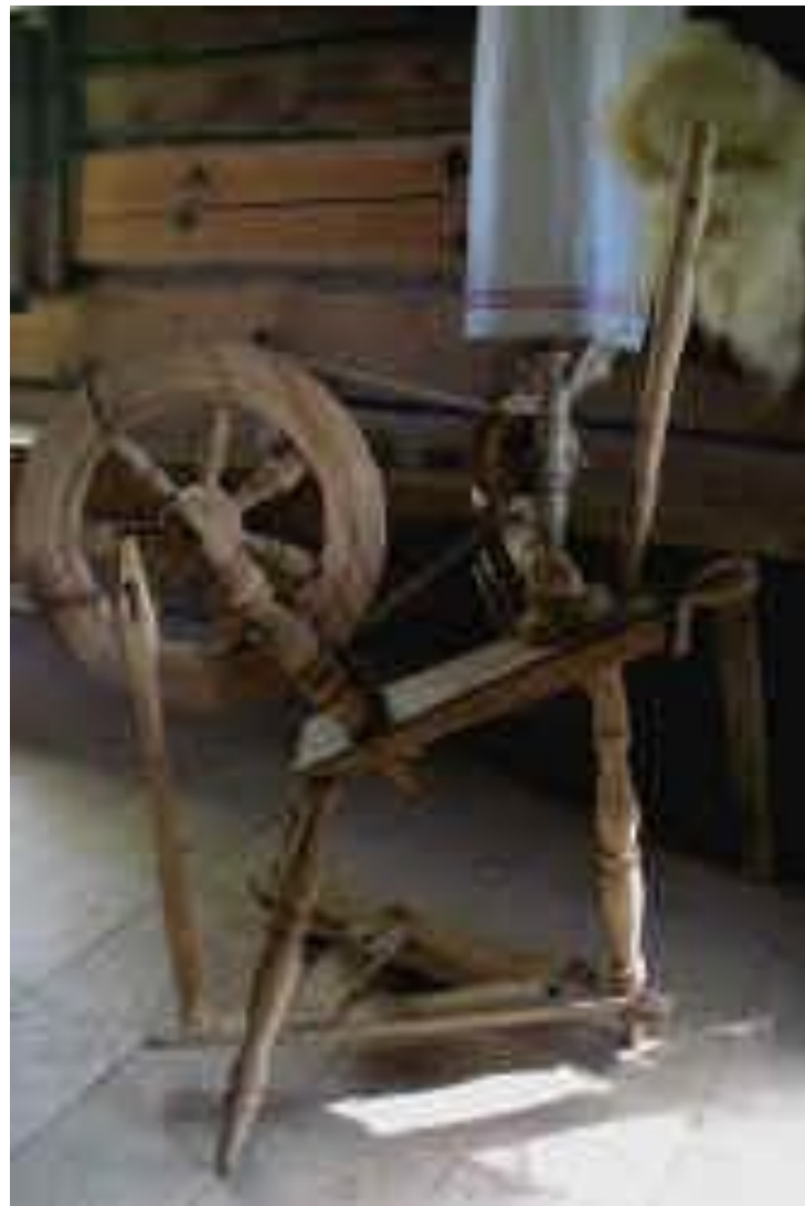
Gulsčias verpimo ratelis. LBM. Rumšiškės. Aukštaičių gryčia

Lietuvoje rateliu verpiama nuo 18 a. I pusės. Ratelis ilgainiui pakeitė verpstę.