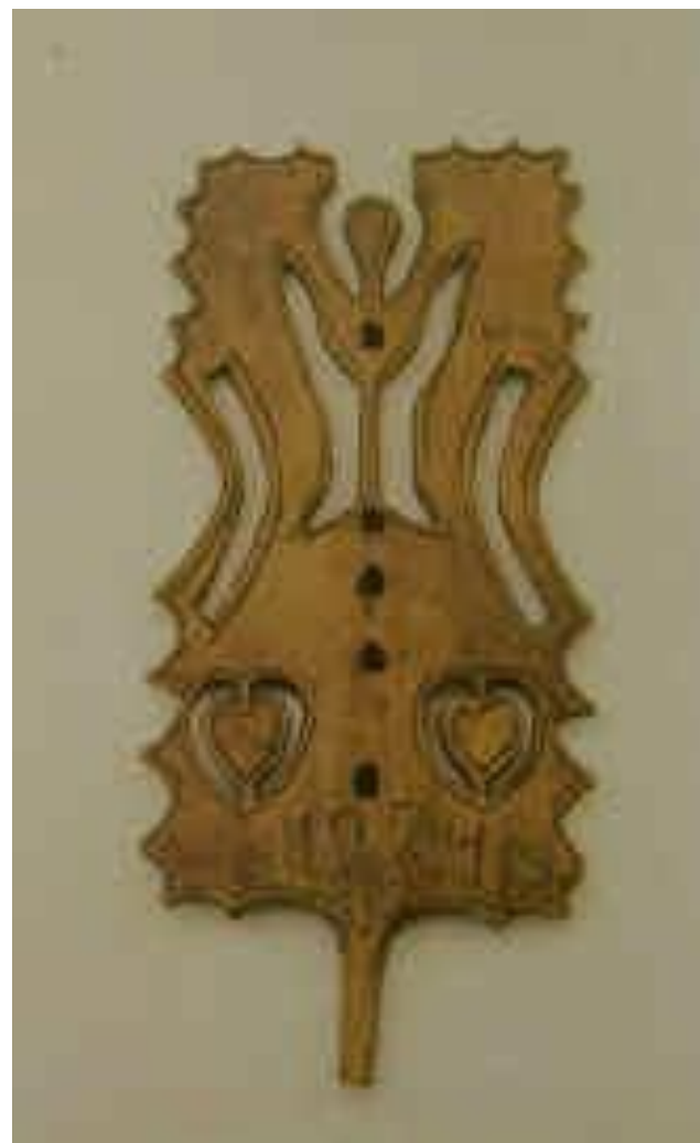
Prieverpstė. Plungės r. 1924

Puošiant didesnis dėmesys buvo skiriamas prieverpstės išorinei pusei, o vidinė išpjaustinėta kukliau ar visai nepagražinta. Dažnai išraižomi prieverpstės padarymo metai. Labiausia išpuoštos yra žemaičių prieverpstės. Kartais prieverpstės buvo daromos kaip dovana mylimai merginai.