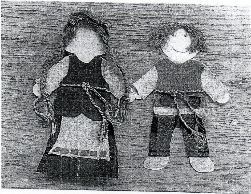
3-4 klasė. Tautinio kostiumo aplikacija. Pavyzdys.

Sekamčiai pamokai' atvires' A. auobnig, siuly ga- bale'is. Aplikuosime lelg. Kaip parodyta piciuypje.